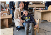
2024年春休み木工教室の様子♪