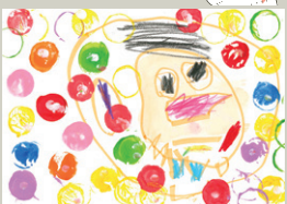
体操教室のボールプール だいすき! 2歳