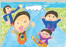
公園のお山の滑り台に 登れるようになったよ 5歳