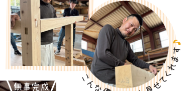
こんな優しい顔も見せてくれます

③加工するための線を引き (=墨付け) その後行う作業が「手刻み」、そして加工した木材を組み上げます。