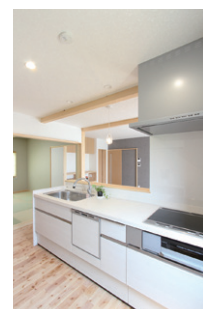
キッチン (親世帯用)