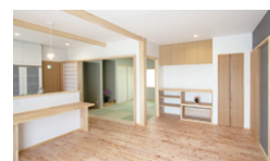
ダイニングキッチン (子世帯用)