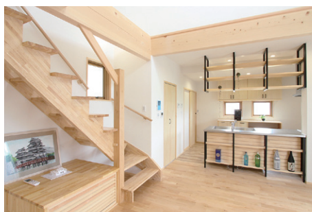
オリジナルキッチンのあるLDK

これまでに完成したおうちは ホームページでもご紹介しています https://kizokunoie.com