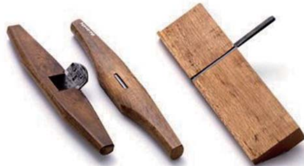
▲ 左より：南京鉋、南京鉋 (裏)、埋椶用横溝鉋