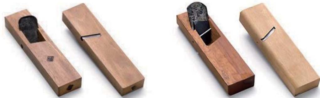
▲ 左より：木口鉋ー右勝手、木口鉋ー左勝手 (裏) ▲ 左より：なぐり鉋ー右勝手、なぐり鉋ー左勝手 (裏)

際鉋の角を丸くしたような形をしている。材にチョウナではつたような模様をつけて化粧をする時に使用する。右勝手、左勝手がある。