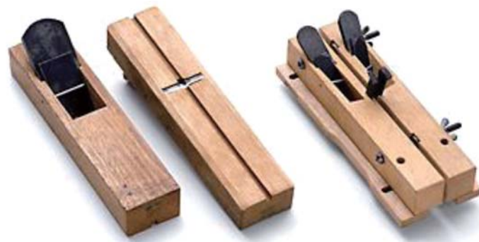
▲ 左より: さね鉋、さね鉋(裏)、自由さね鉋

印籠鉋の雄木用とほぼ同じ構造をしている。印籠鉋の凸面は、断面が台形のようにやや傾斜しているが、さね鉋は直角の凸面を作る。床板を張り合わせる時、片側に凸面を作るのに使用する。二枚の刃を並べて仕込んだ台が中央で割れて、ネジで面の幅が調節できるようになったものもある。これを自由さね鉋と呼ぶ。