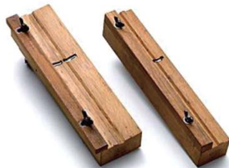
▲ 写真(左): 印籠鉋一角・雄木用(裏) 写真(右): 印籠鉋一角・雌木用(裏)