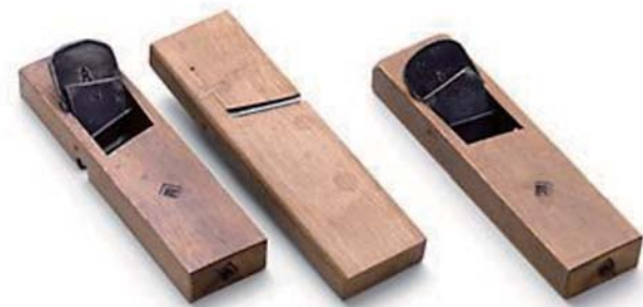
▲ 左より：際鉋 (右勝手)、際鉋 (右勝手・裏)、際鉋 (左勝手)