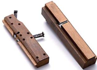
▲ 左より：組手決り鉋、窓枠決り鉋 (裏)

大阪型底決り鉋と良く似た構造だが、幅が広く、段欠きも深い。洋風建築などに使う上下窓の窓枠の、戸の滑る溝を削るのに使用する。