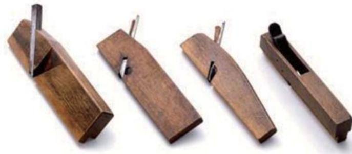
▲ 左より：荒決り鉋、底決り鉋(櫛型)、底決り鉋(西型)、底決り鉋(大阪型)