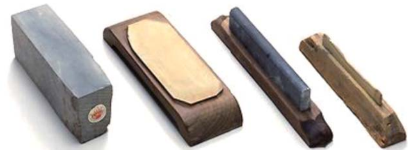
▲ 左から天然中砥、天然仕上げ砥、曲面用砥石2点