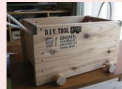
↑重くおもちゃ箱(お客様ver.)