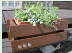
↑プランター(お客様ver.)

4月の木工教室に参加して下さったご家族からメールが届きました♪ 素敵なアレンジだったので、載せちゃいます♪ お知らせくださり、ありがとうございました。