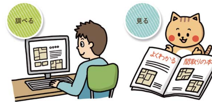
インターネットで情報収集