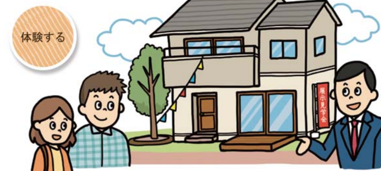
完成見学会や家づくりOBお宅の訪問