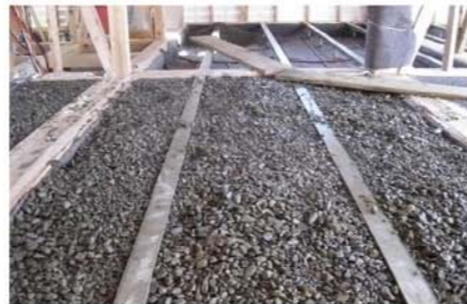
オンドルエコノ施工中