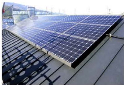
太陽光パネル設置