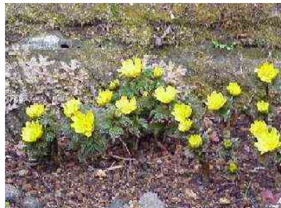
キンポウゲ科フクジュソウ属の多年草。寒い北海道、東北の山地に自生。日当たりの良い斜面で多く見られます。春一番に咲く縁起の良い花として床飾りなどに用いる。花言葉は「しあわせを招く」です。