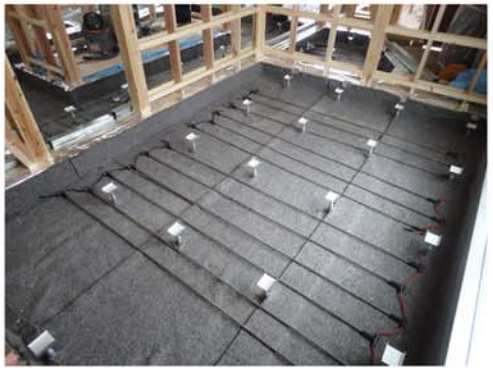
5. 熱源となるヒーターの配線