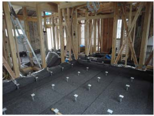
4. 専用ウエスを隙間なく敷きます