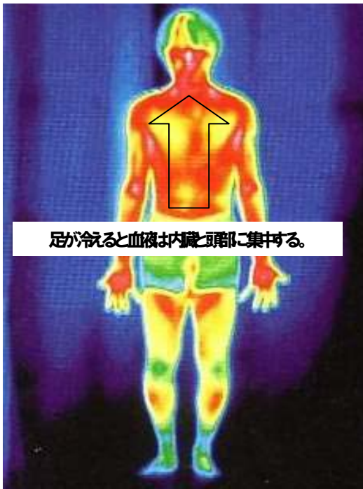
足が冷えると血液は内臓と頭部に集まる。

寒いトイレや脱衣室で倒れたり、湯舟の中で「ヒートショック」をおこし溺死する事故が後をたたないのはこのためです。