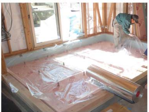
2. 断熱材を敷き詰めます