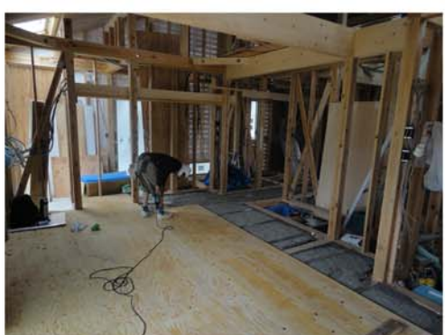
10. 床合板の捨て張り