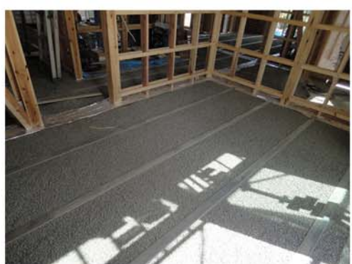
9. 蓄熱砂利をきれいに均します