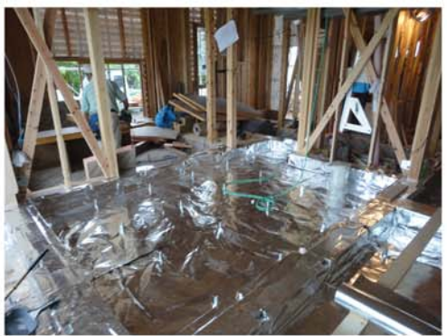
3. 遮熱シートで覆います