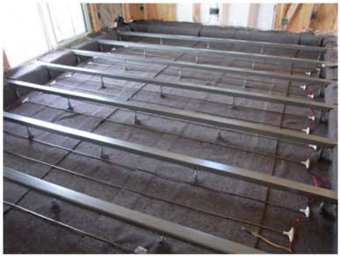
6. 鋼製大引きの設置